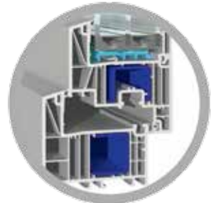
Brüggmann bluEvolution: 82 AD