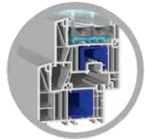
Brüggmann bluEvolution: 82 MD